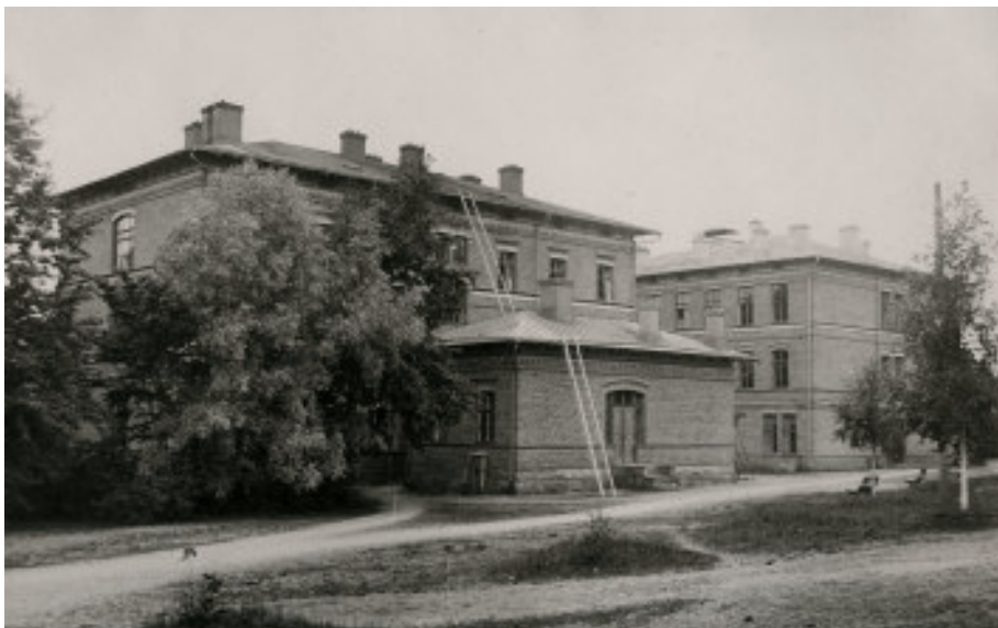
Seminaarin naisosaston rakennuksia. Vasemmalla naisten asuntola, oikealla taaempänä olevassa rakennuksessa oli opetustiloja ja tyttömallikoulu. Kuva on todennäköisesti 1920-luvulta.