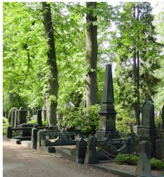
Vilhunen, Saara, kuvaaja 2007. Museovirasto

Tilastokeskus on tallentanut tilastotietoa vuoden 2018 presidentinvaalista monesta näkökulmasta.